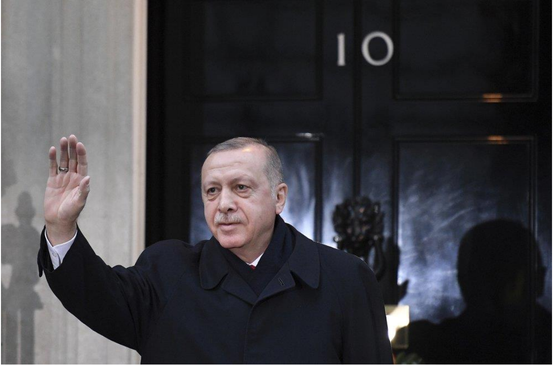
“Türkiye Cumhurbaşkanı Recep Tayyip Erdoğan, NATO zirvesinden önce Londra’da 3 Aralık 2019 Salı günü 10 Downing Street’e geldi.” [Erişim Tarihi: 05.01.2021]

Haberde kullanılan fotoğraflar AP’nin fotoğraf havuzundan alınmıştır. Erdoğan’ın NATO zirvesi öncesi çekilmiştir.