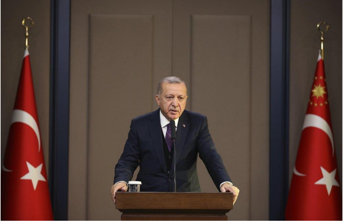
“Türkiye Cumhurbaşkanı Recep Tayyip Erdoğan, 3 Aralık 2019 Salı günü Ankara, Türkiye’de bir NATO liderinin zirvesine katılmak üzere yola çıkmadan önce konuştu” [Erişim Tarihi: 05.01.2021]

yedirildiği görülmektedir. Anlaşmanın “tartışmalı” olarak nitelendirilmesi tamamen bölgede maksimalist bir anlayışla hareket eden ülkelerin oluşturmak istedikleri Türkiye algısıyla ilgilidir.