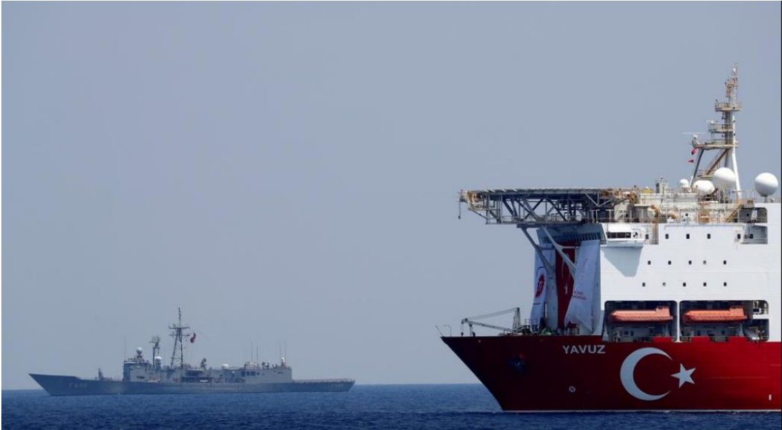
[Erişim Tarihi: 01.01.2021]

Bu başlık, literatürde ifade edildiği gibi Doğu Akdeniz’deki enerji kaynaklarının aranması hususunda ülkeler arasındaki tartışmayı vurgulayarak Türkiye’nin Libya ile anlaşma yaptığını ifade etmektedir. Dolayısıyla başlığın mevcut durumu özetleyici olduğu ve nispeten nesnel görüldüğü söylenebilir. Fakat “arama tartışmaları sırasında” ifadesi, bu anlaşmanın sanki bu tartışmaları daha da körükleyeceğini, dolayısıyla Türkiye’nin çok da iyi bir şey yapmadığını hissettirmektedir. Nitekim haberin giriş kısmında bu anlaşmanın Ankara’nın enerji aramaları ile ilgili diğer ülkelerle olan tartışmalarını karmaşıktırabileceği, söylenmiştir. Bu söylem, yapılan anlaşmanın meşruluğunu zedelemek için özellikle kullanılmıştır. Zira anlaşma uluslararası deniz hukukuna uygun bir anlaşmadır ve bilakis tartışmaları azaltması lazımdır. Çünkü kanuni bir dayanağı vardır ve meşrudur. Ama bölgedeki çıkar sahibi ülkeler anlaşmanın meşruluğunu zedelemek istemektedir. Bunların başında da Fransa ve Avrupa ülkeleri gelmektedir. Zira Yunanistan, Avrupa Birliği’ni yardımına çağırmıştır.